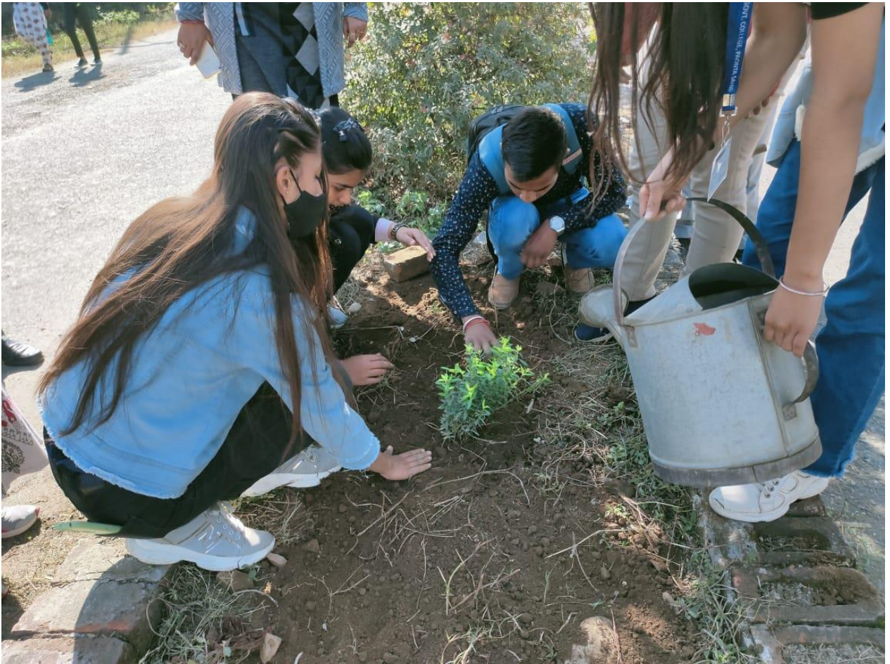
Photograph 54 Students involved in plantation in HIMUDA Colony