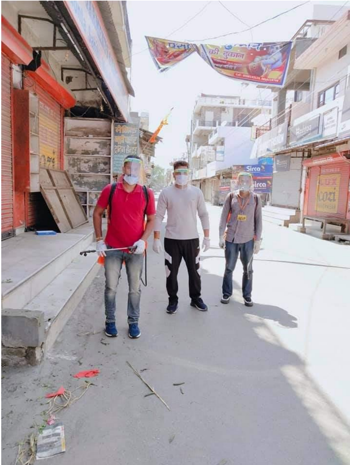
Photograph 36 Students taking part in Sanitisation of public places