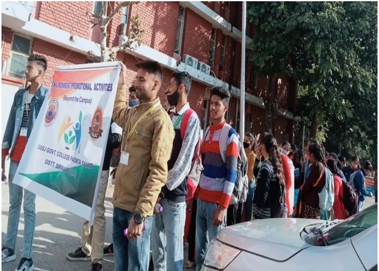
Photograph 52 Students participating in rally on "Nadi Bachao Awareness" in city during Nadi Utsav