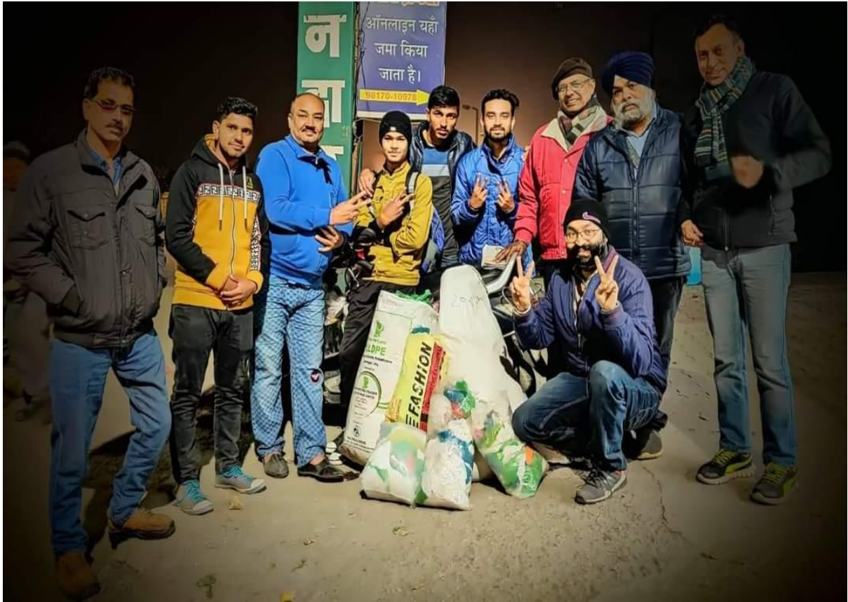
Photograph 59 Students cum rotaractors of college with Clean Paonta Green Paonta Officials