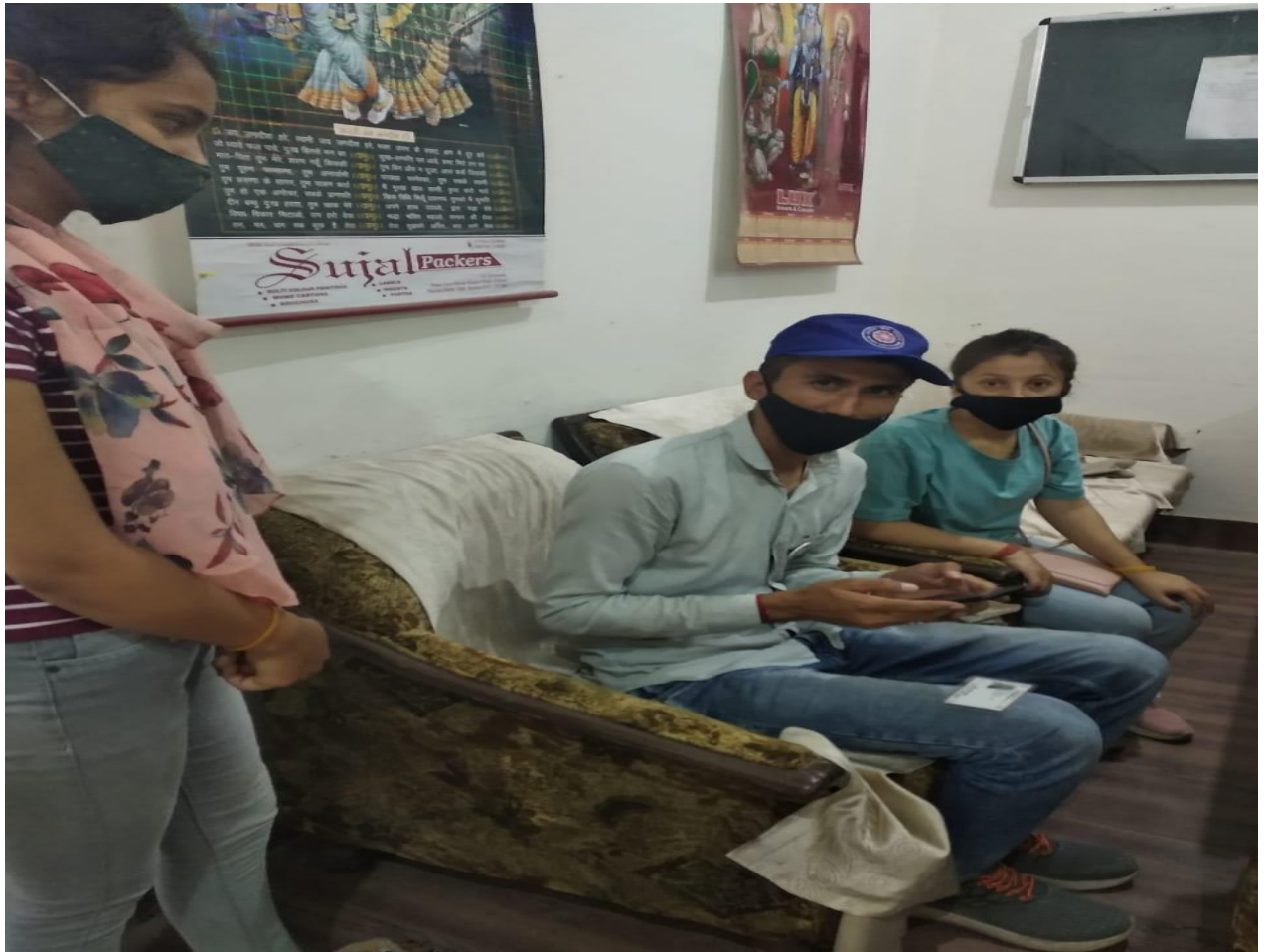
Photograph 19 Volunteers helping in registration of people for vaccination