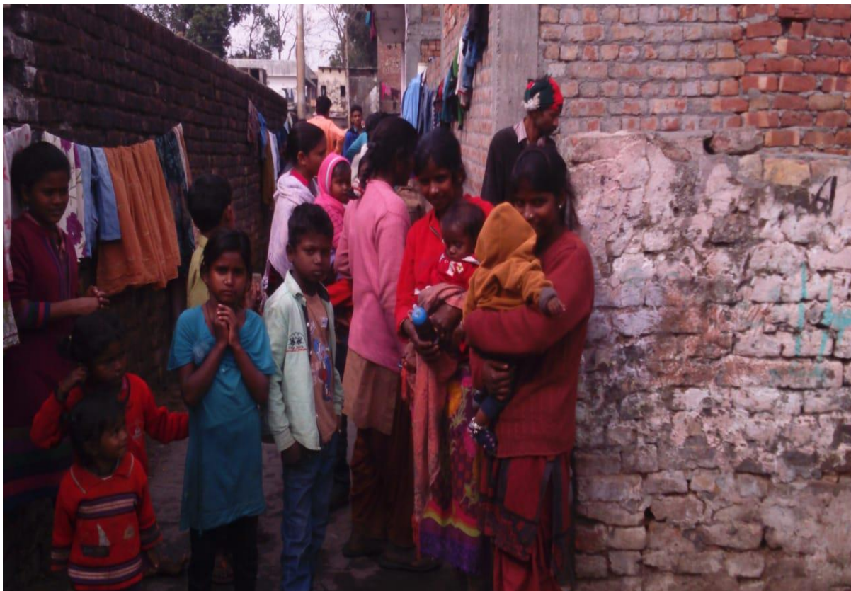
Photograph 6 Children interacting with students in Madrasi Basti