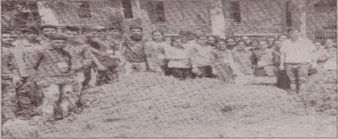
स्वच्छता पखवाड़ा के दौरान उपस्थित छात्र व अध्यापक।