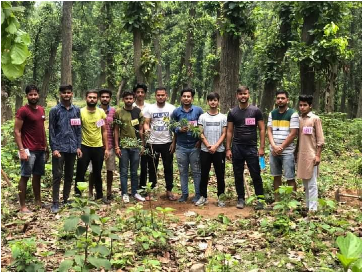
Photograph 57 Group of students during plantation at Puruwala Katapathar on 28.07.2020