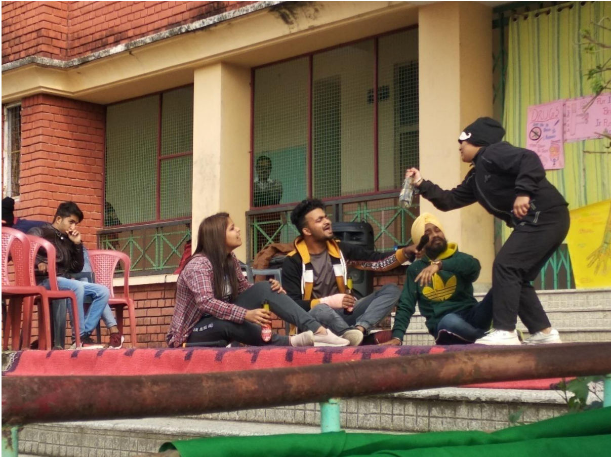
Photograph 34 Nukkad Natak performed by students for promoting "Say NO to Drugs"