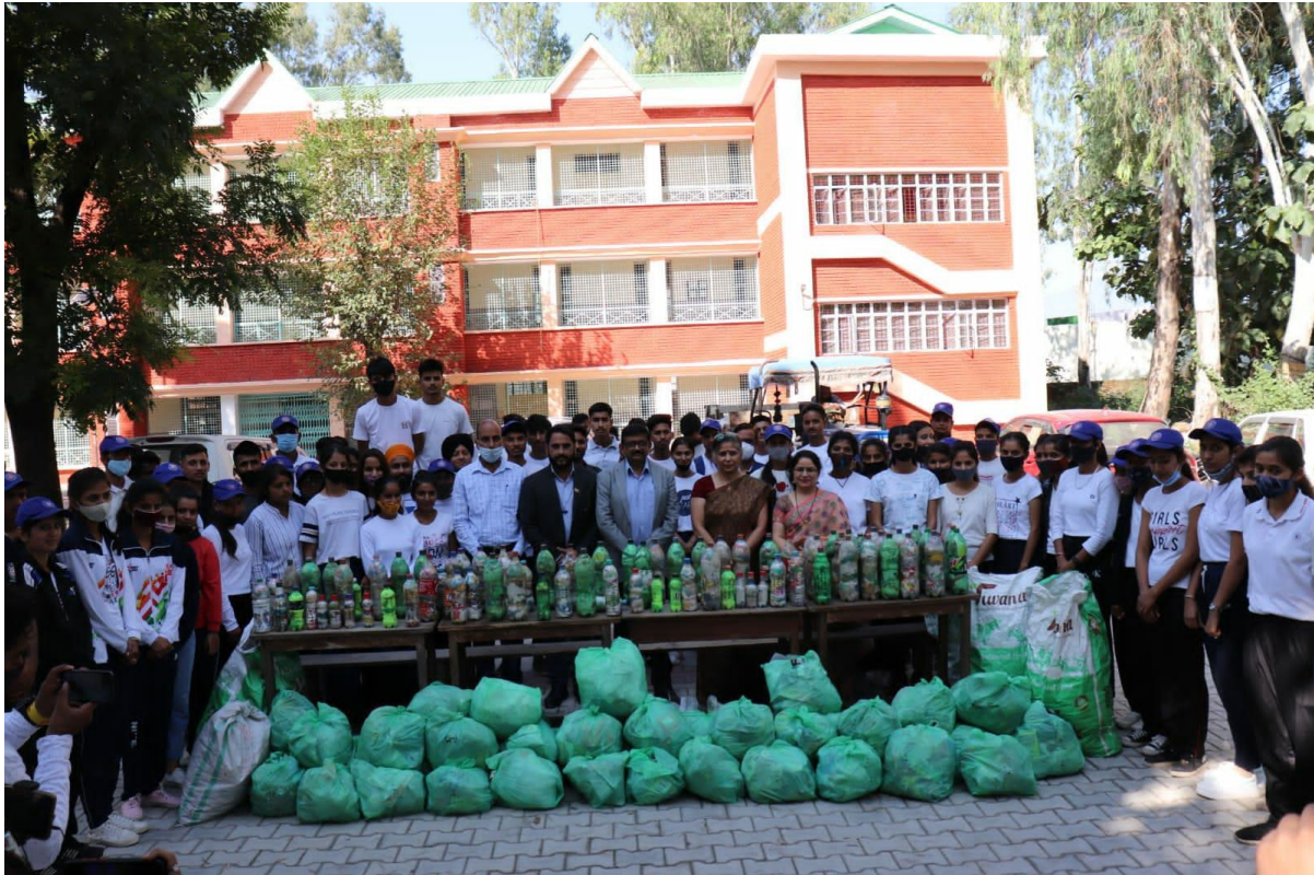
Photograph 64 Sub-Divisional Magistrate, Principal With NSS Unit On Closing of Clean India Program