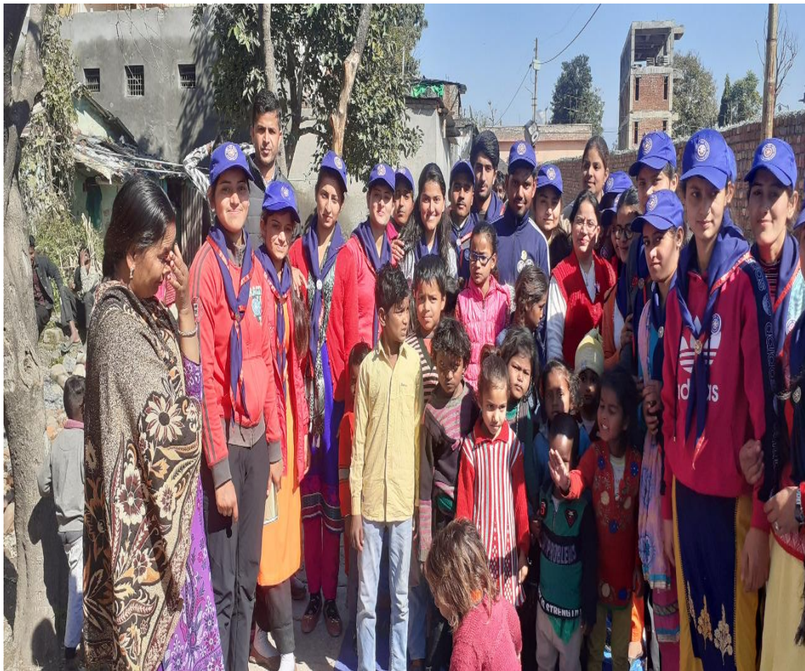
Photograph 51 Volunteers at Slum area adjacent to Yamuna river with children