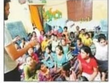
माजरा में खुशियों का बैंक केंद्र में बच्चों को जानकारी देते पदाधिकारी।