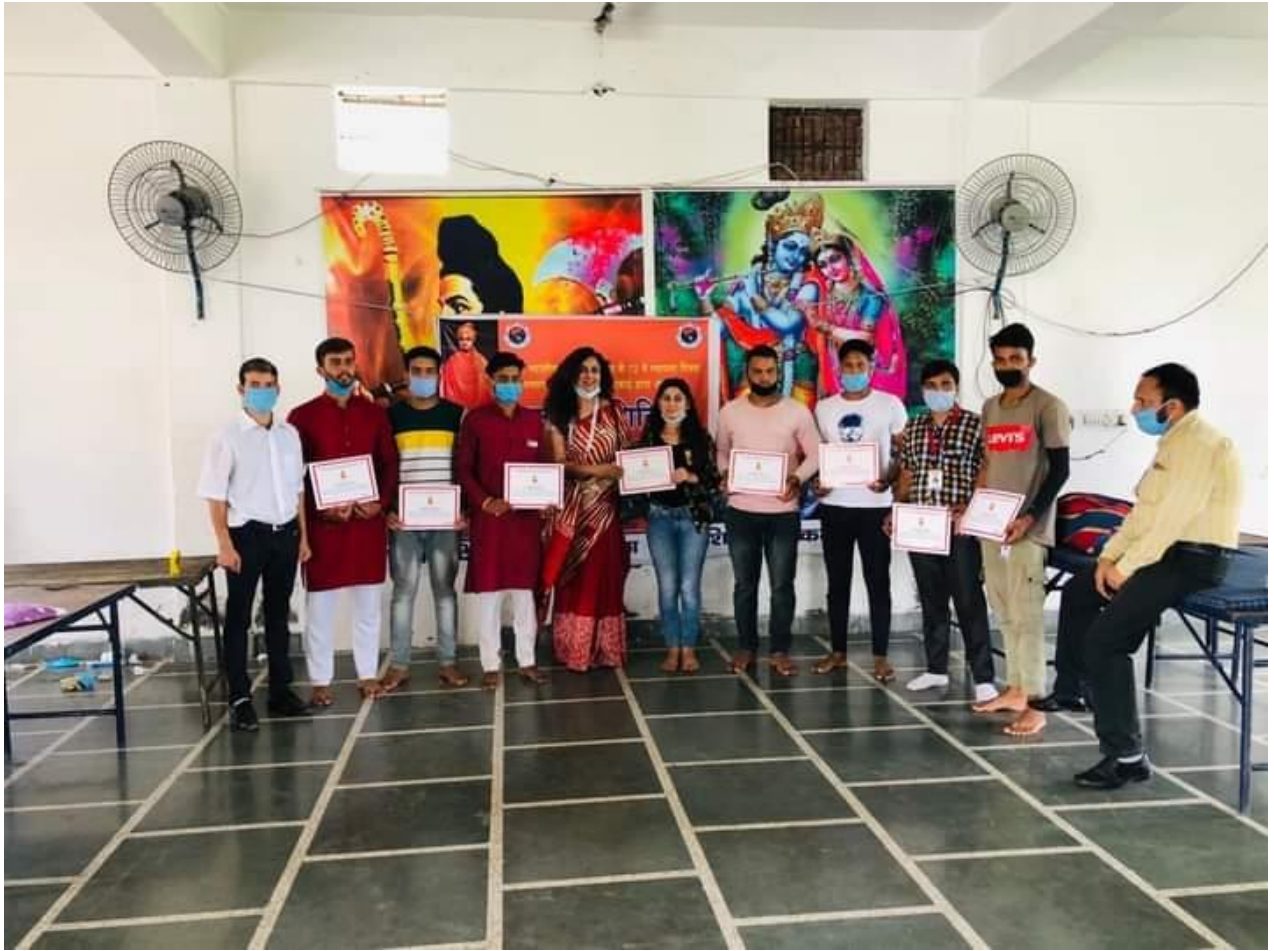
Photograph 22 College students with certificates of blood donation