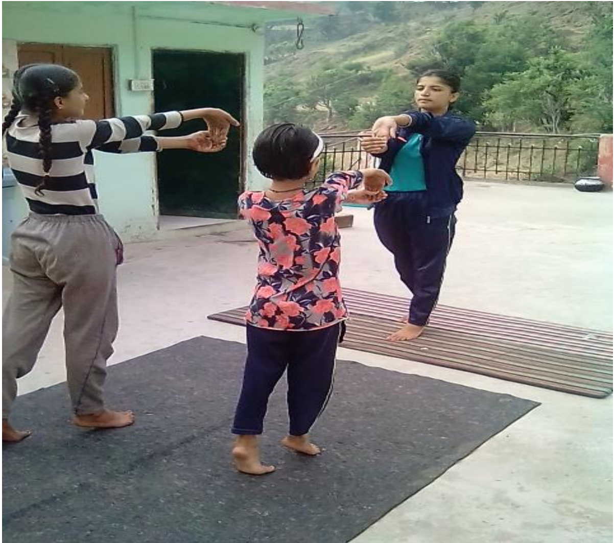
Photograph 40 Volunteer giving training to children in her village on International Yoga Day during lockdown