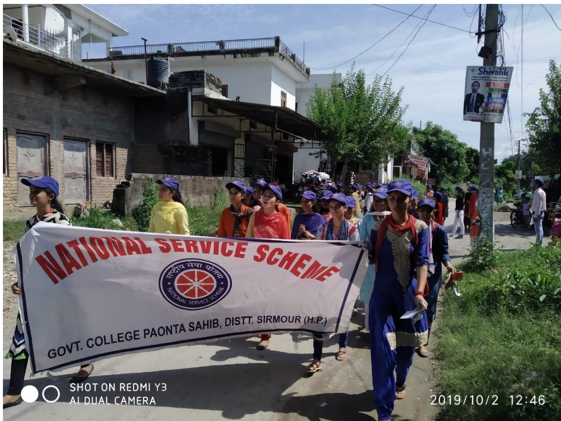
Photograph 48 Rally during fit india plogging race on 02.10.2019