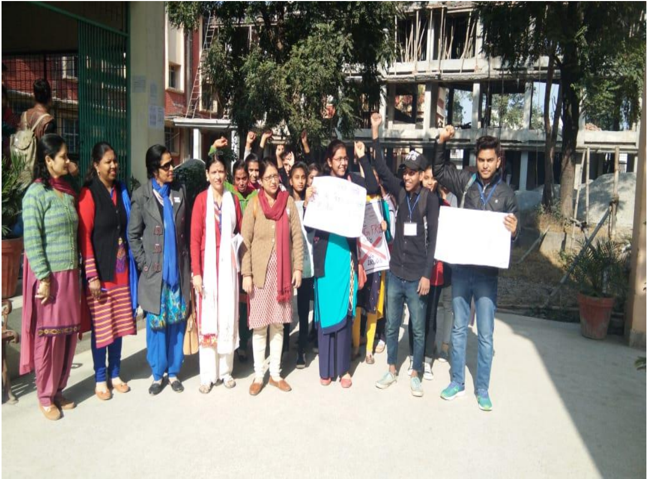
Photograph 16 Staff and students before proceeding on to rally on HIV/AIDS