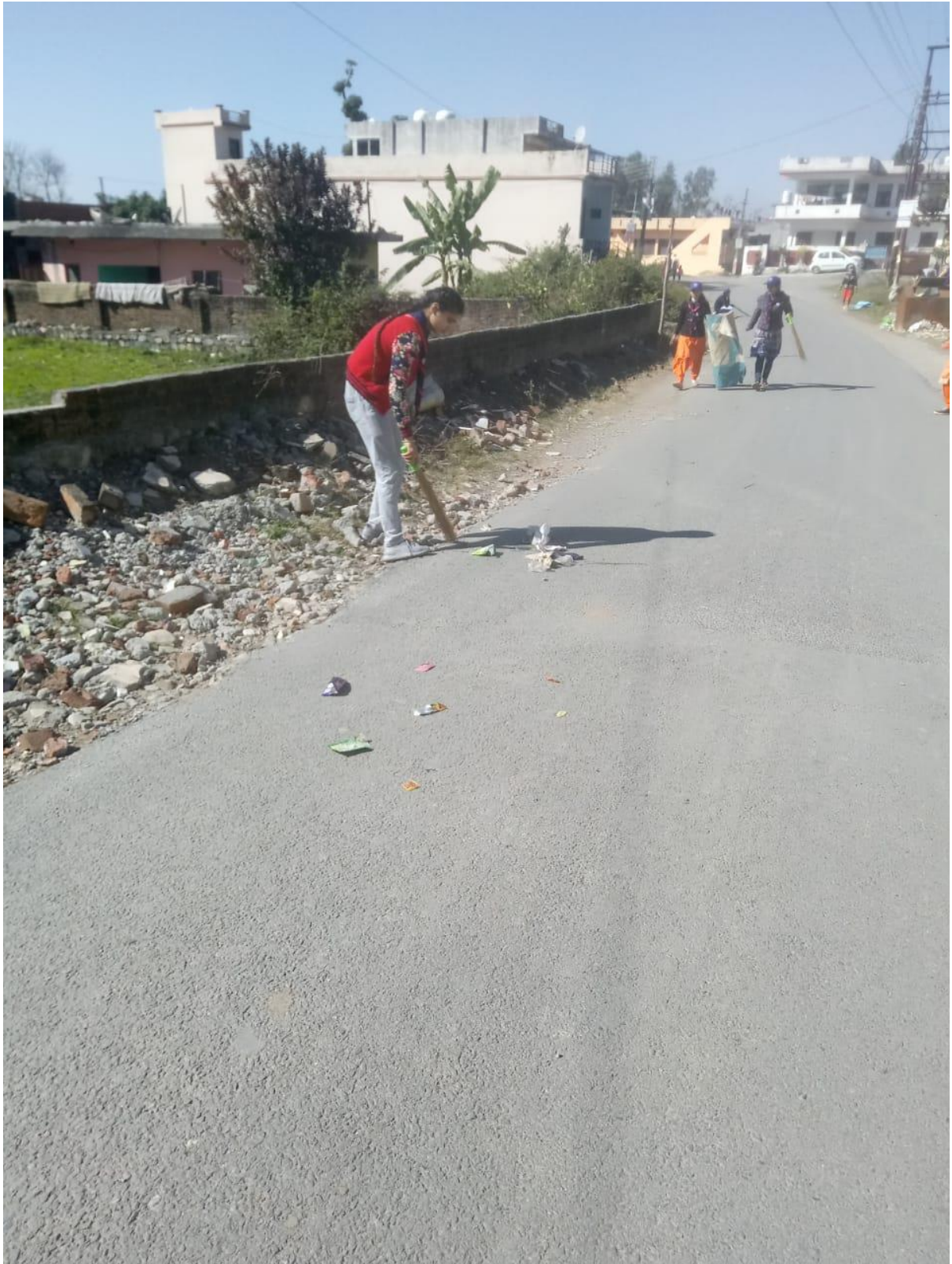
Photograph 14 Students cleaning road to HIMUDA Colony