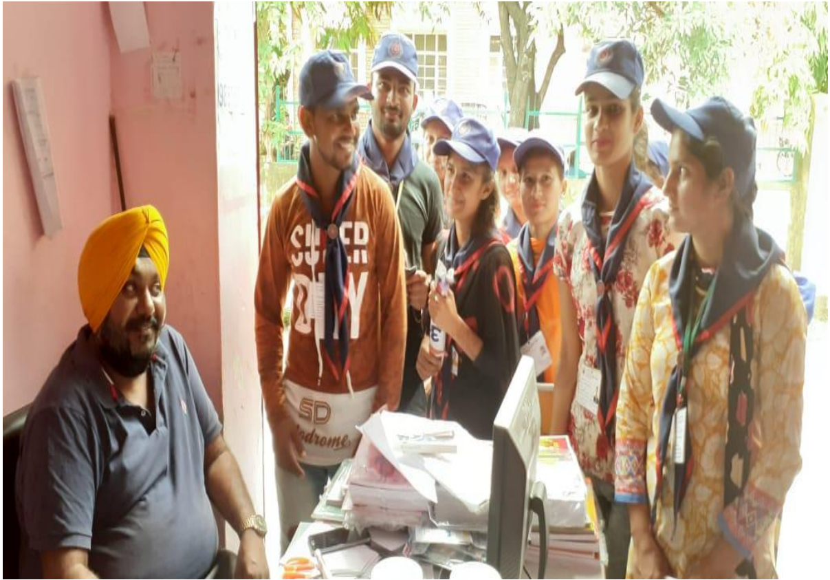
Photograph 13 Students talking to shopkeeper outside college premise regarding Swachhta Abhiyaan on 09.08.2019