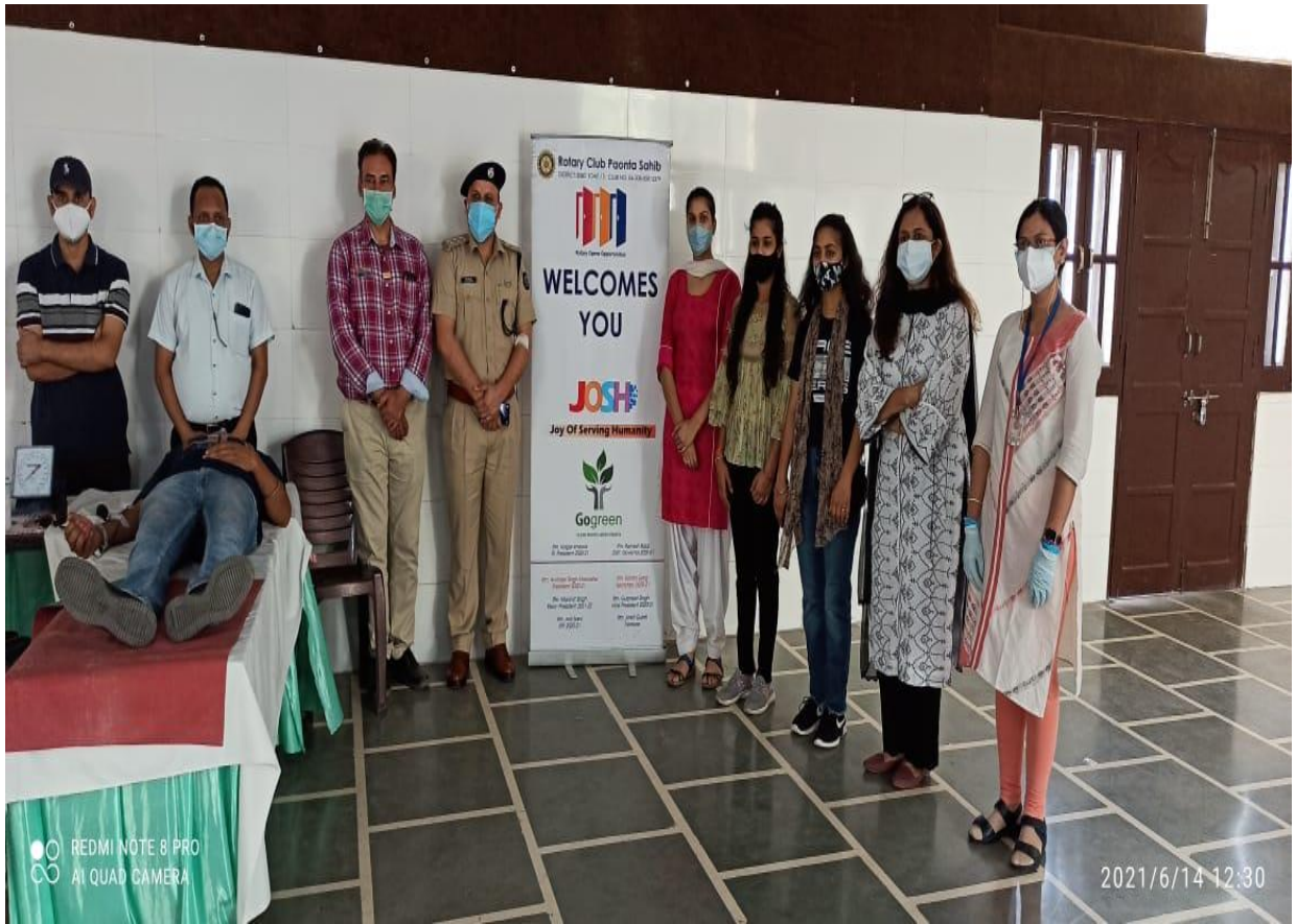
Photograph 21 Rotaractors with organisers of blood donation camp on 14.06.2021