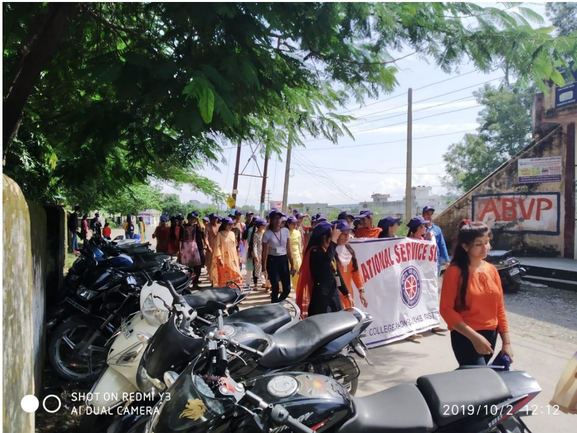
Photograph 47 Rally during fit India plogging race on 02.10.2019