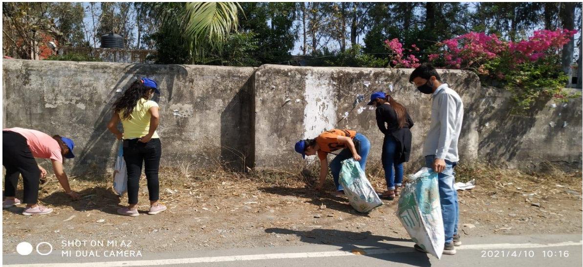
Photograph 10 Students outside the college boundary