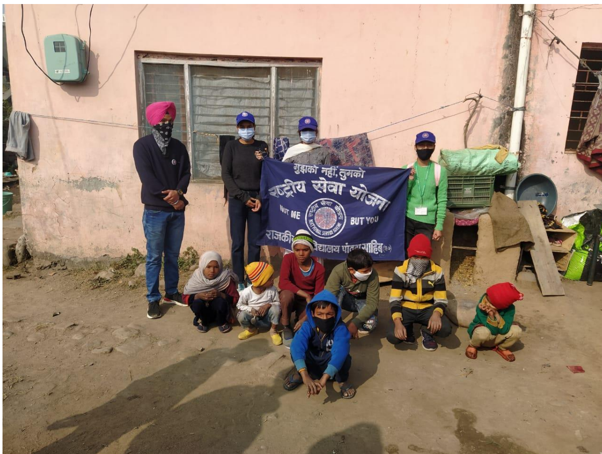
Photograph 27 Students in Kunja Matralio with children

Shubhkhedha, Kunja Matralion, Behrewala were the villages adopted under unnat Bharat Abhiyan by the NSS Unit of the college. Various activities like cleanliness drives, drug awareness activities, Covid 19 awareness program etc are conducted.