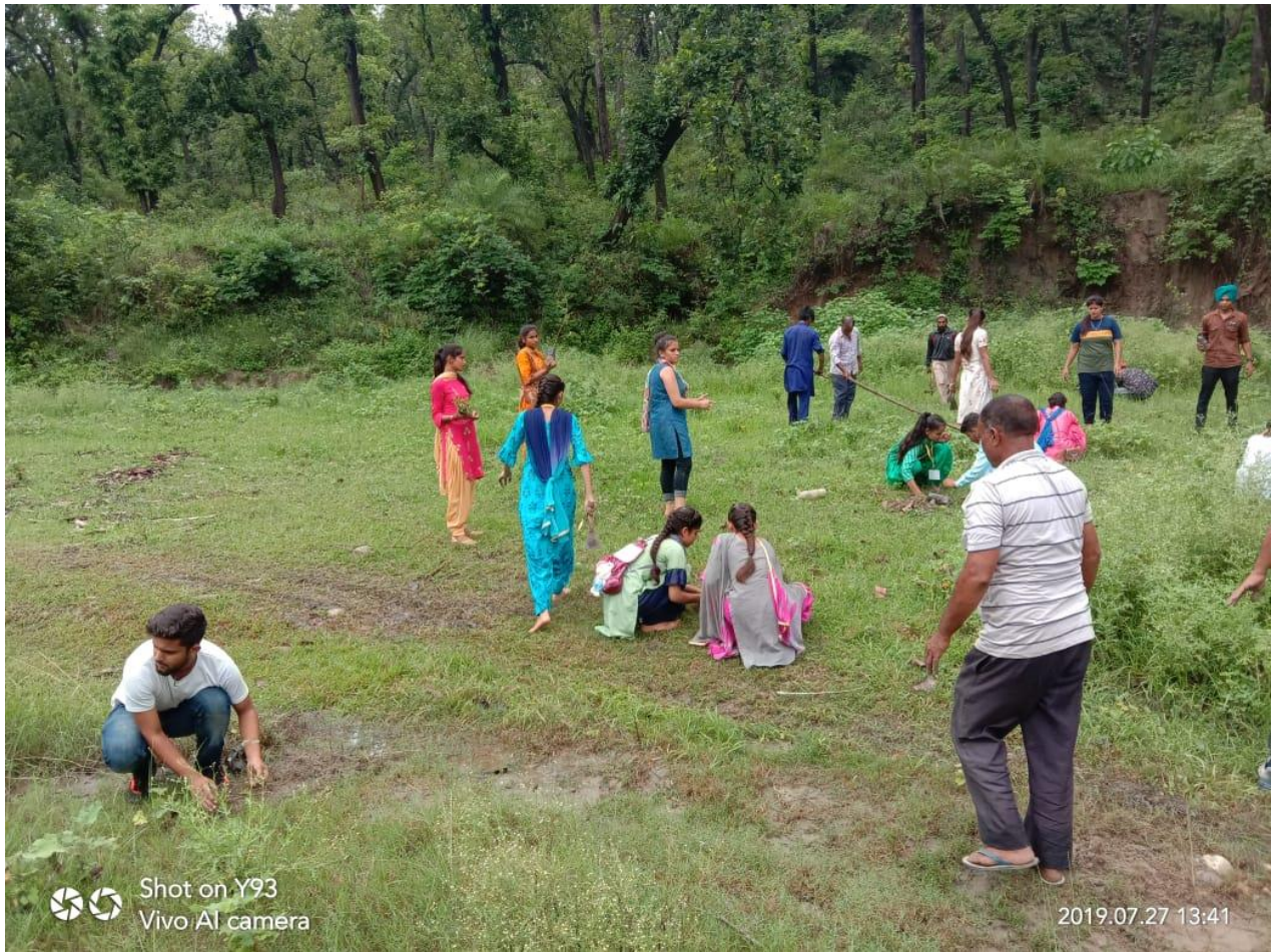
Photograph 56 Vriksh Lagao, Paryavaran Bachao Campaign by students in Soorajpur