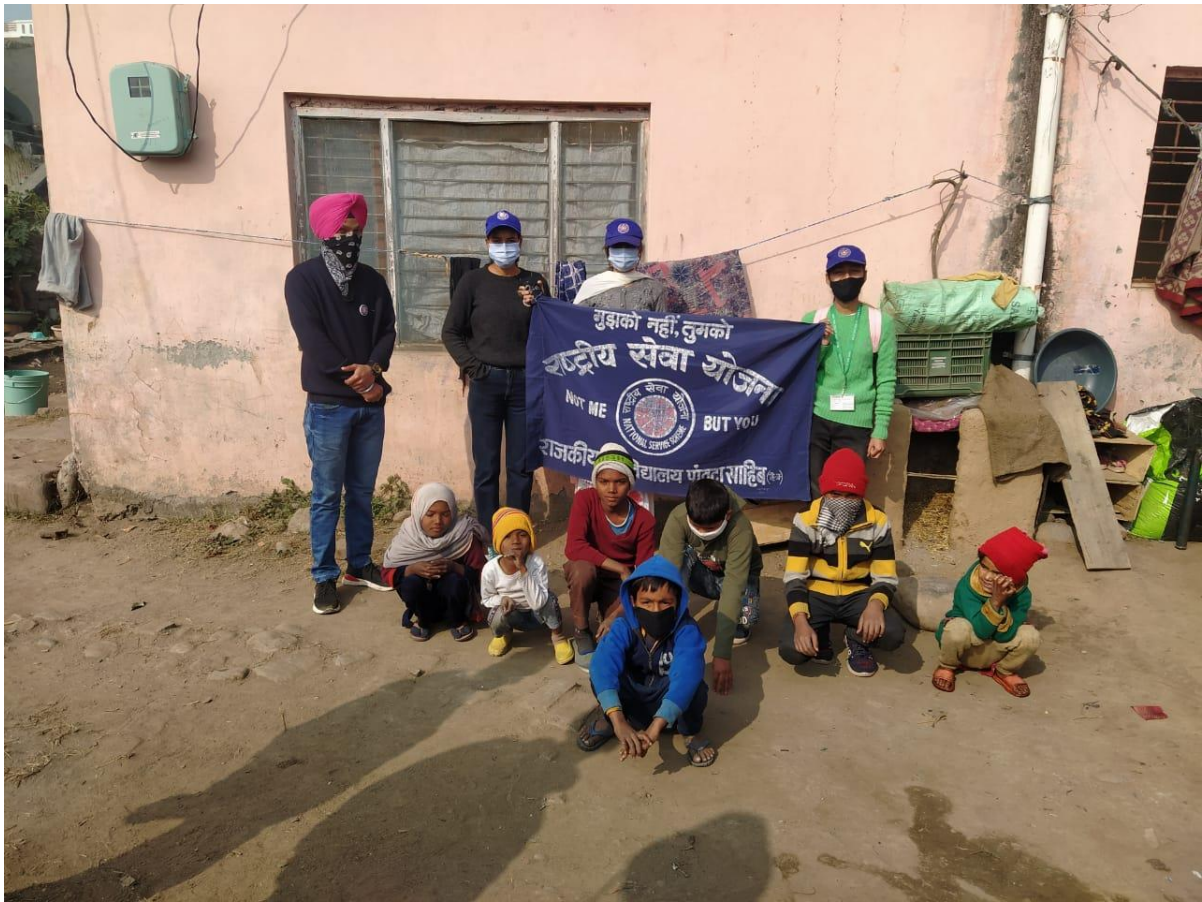
Photograph 65 Students with children in adopted village Kunja Matralion for asking them to observe the SOPs of Covid Pandemic, about literacy and to continue their education during covid pandemic