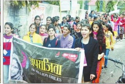
पांवटा साहिब में अपराजिता रैली में भाग लेती छात्राएं।