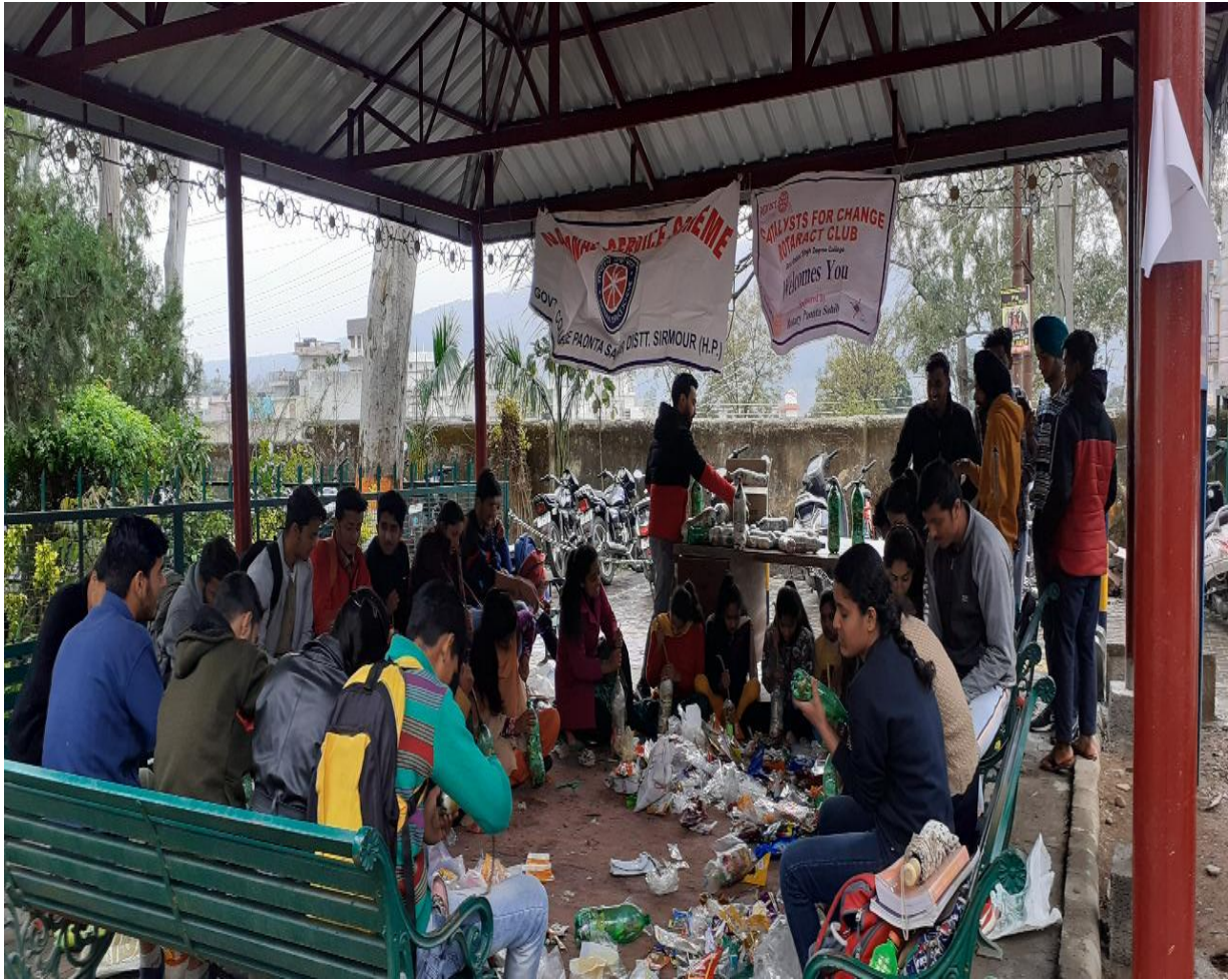
Photograph 61 NSS Unit cum rotaractors while making poly bricks