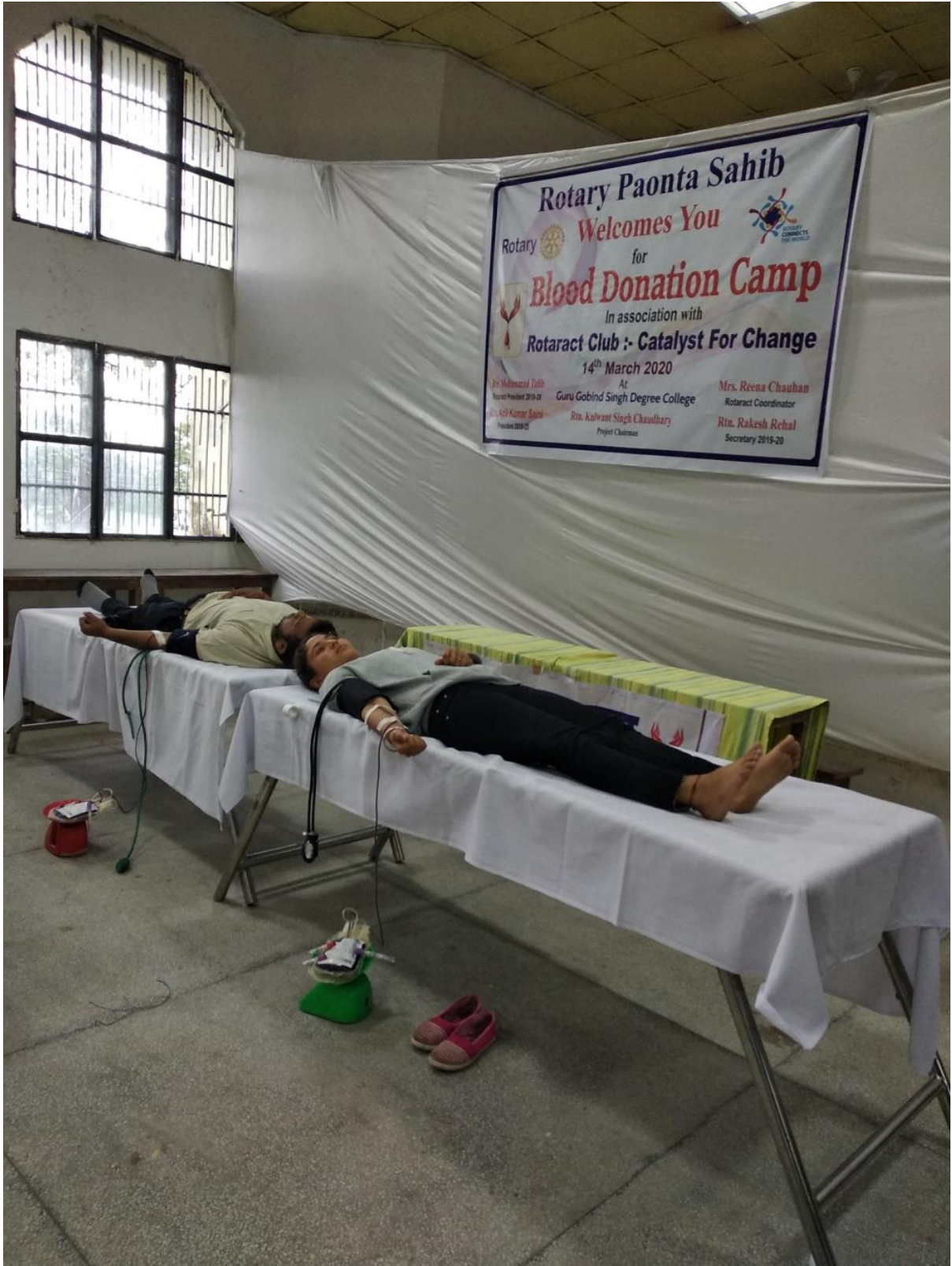
Photograph 20 Students donating blood in college on 14.03.2020