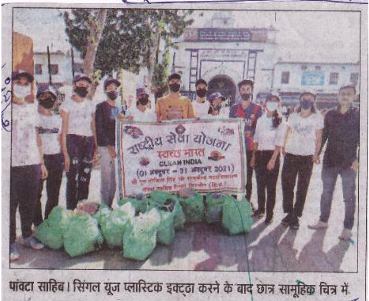
News Clip 18 Divya Himachal 14.10.2021 p.4