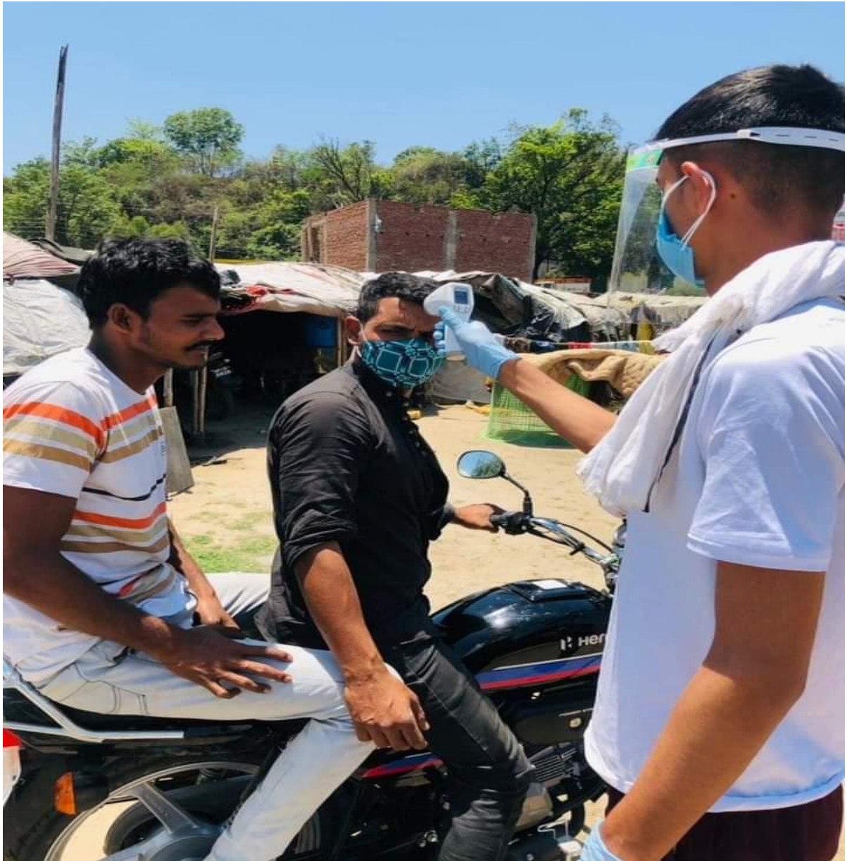
Photograph 4 Thermal Screening by student of college in Slum area