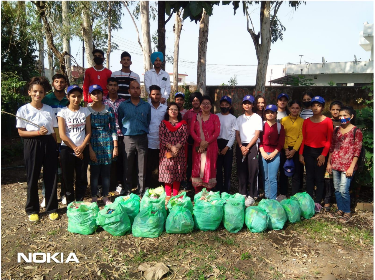
Photograph 62 Group of volunteers with staff after collection of plastic from Canal Road, Shani Temple and Devinagar