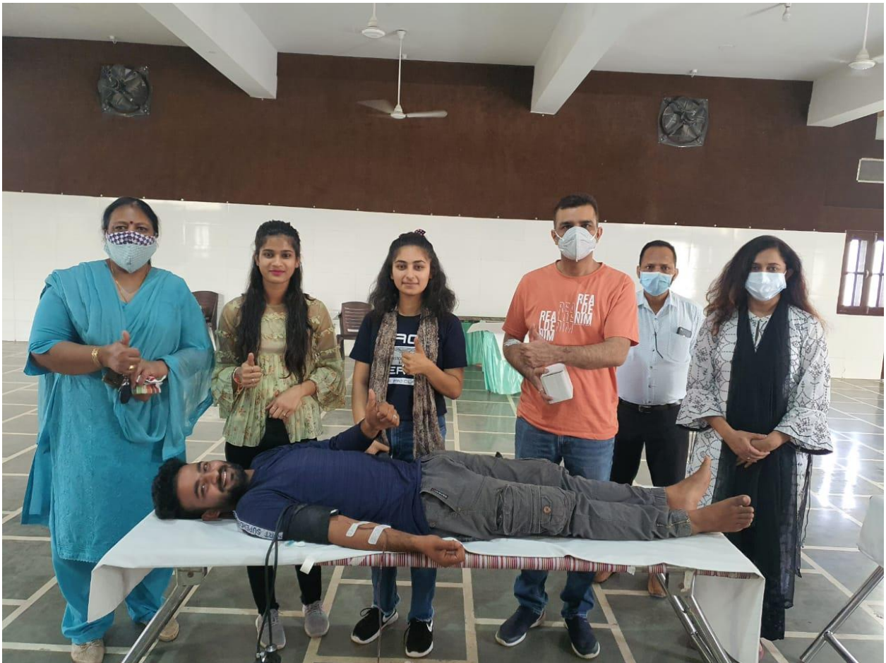
Rotaractors participating in blood donation camp in Gyan Chand Dharamshala on 14.06.2021

The students and staff enthusiastically organise and participate in Blood donation camps. The institution has managed to provide life-saving help to people and patients with these blood donation camps. Since 2018, the institution has organized four camps in the college under the initiative of different clubs like NSS, R&R , Red Ribbon Club etc. The rotaract club “Catalyst for Change” not only participates in these camps in college campus but also joined hands with the Rotary Club during Covid 19 pandemic to donate blood in Gyan Chand Dharamshala on 14 th June 2021.