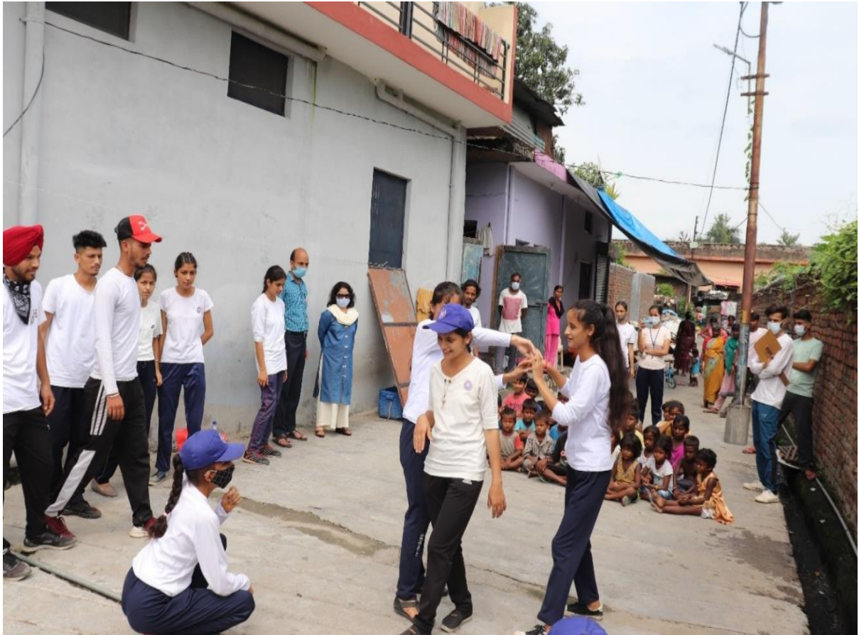
Photograph 2 College students inspiring kids to observe Cleanliness through Nukkad Natak on "swachhta" at Kripal Sheela Road Slum Area adjacent to the river Yamuna