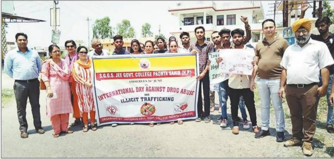
पांवाटा साहिब में नशा निवारण रैली निकालते कॉलेज के शिक्षक व विद्यार्थी।