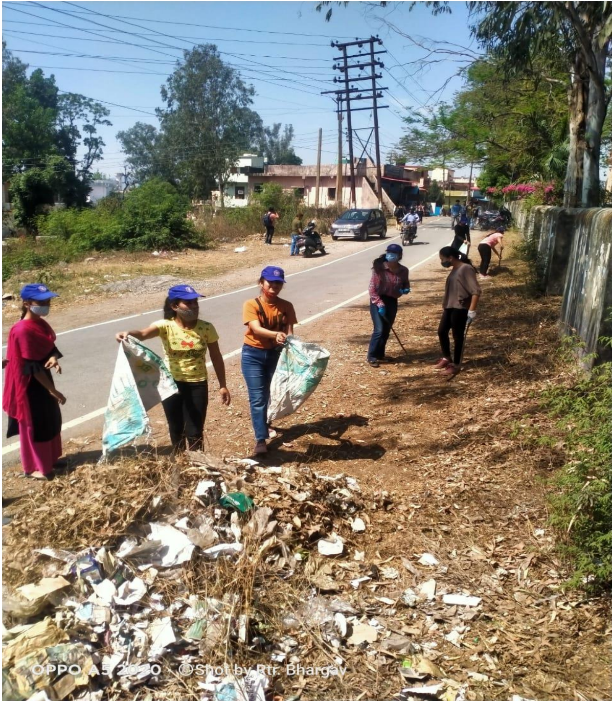
Photograph 12 Students outside the college boundary