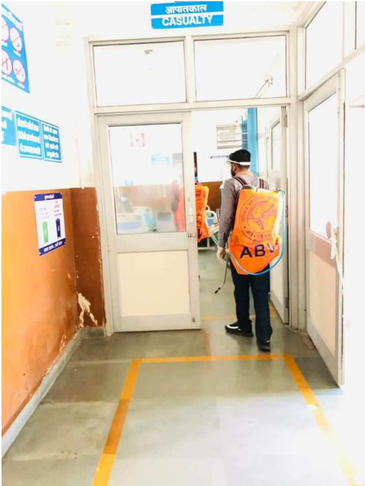
Photograph 37 Sanitisation in City Hospital