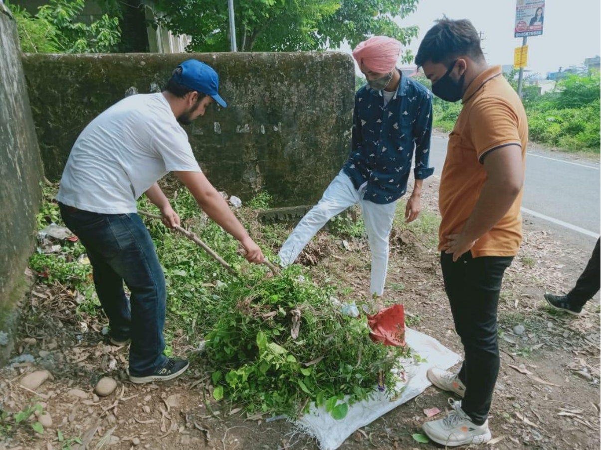
Photograph 9 Students engaged in eradication of weeds out of boundary wall area