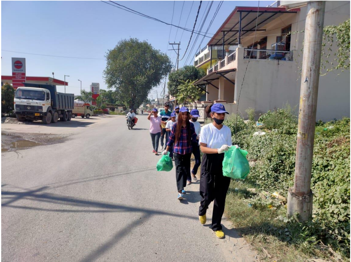
Photograph 58 Students at Devinagar for collection of single use plastic