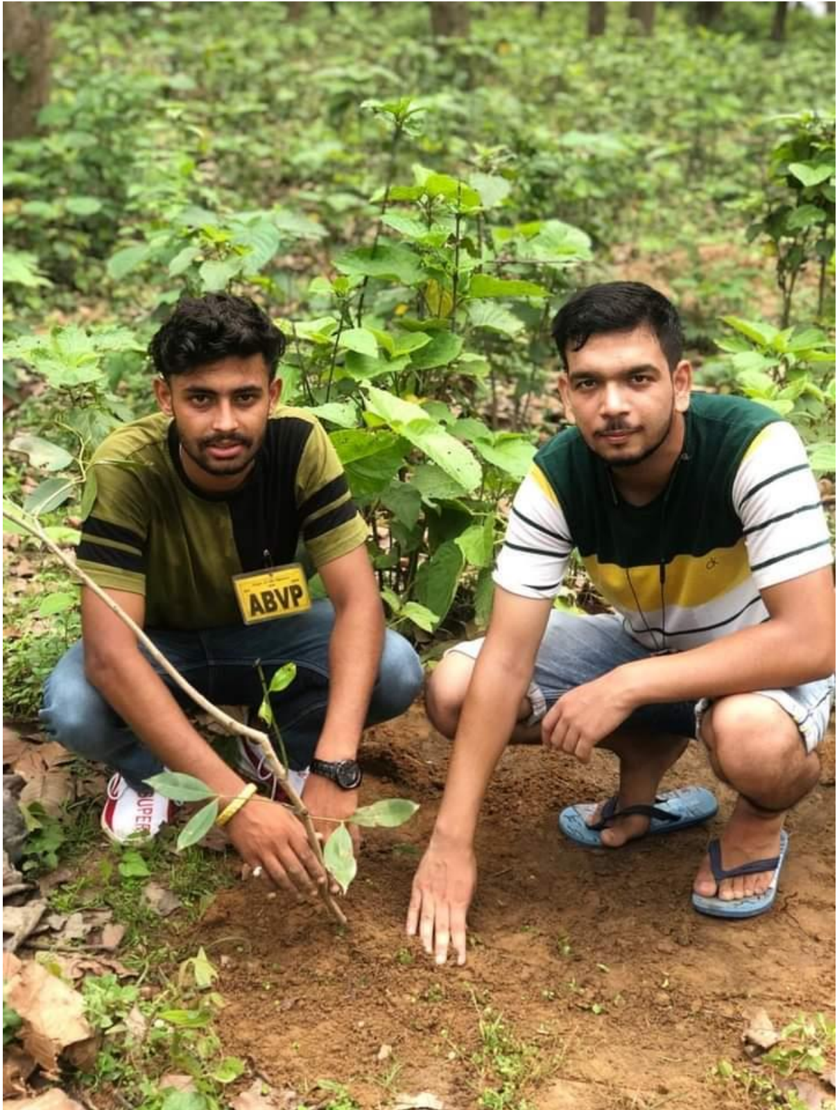
Photograph 45 Students planting a tree