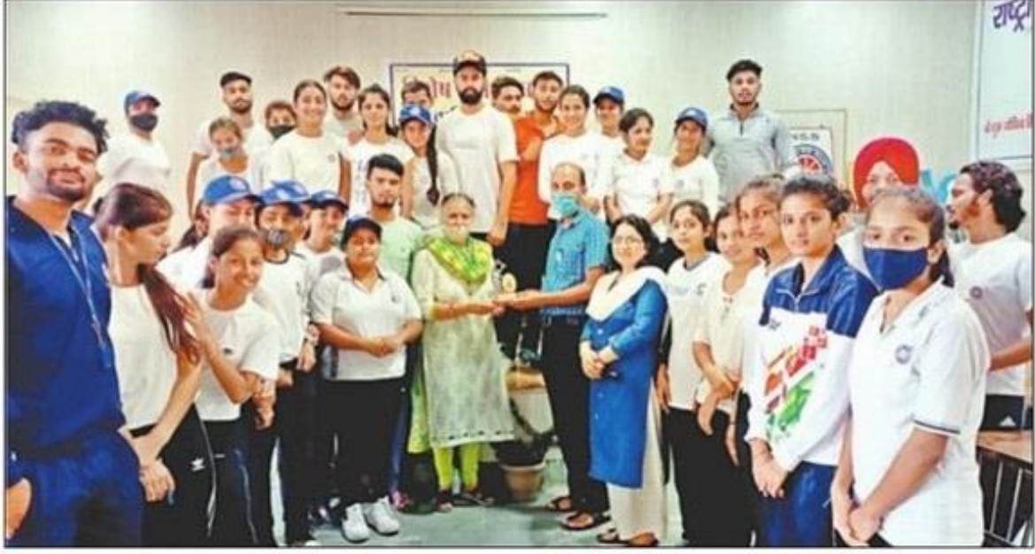
पांवटा साहिब कॉलेज में एनएसएस शिविर के पांचवें दिन आयोजित कार्यक्रम में प्राचार्य और स्वयंसेवी। संवाद