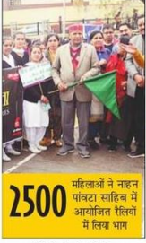
महिलाओं ने नाहन पांवटा साहिब में आयोजित रैलीयों में हिस्सा भाग