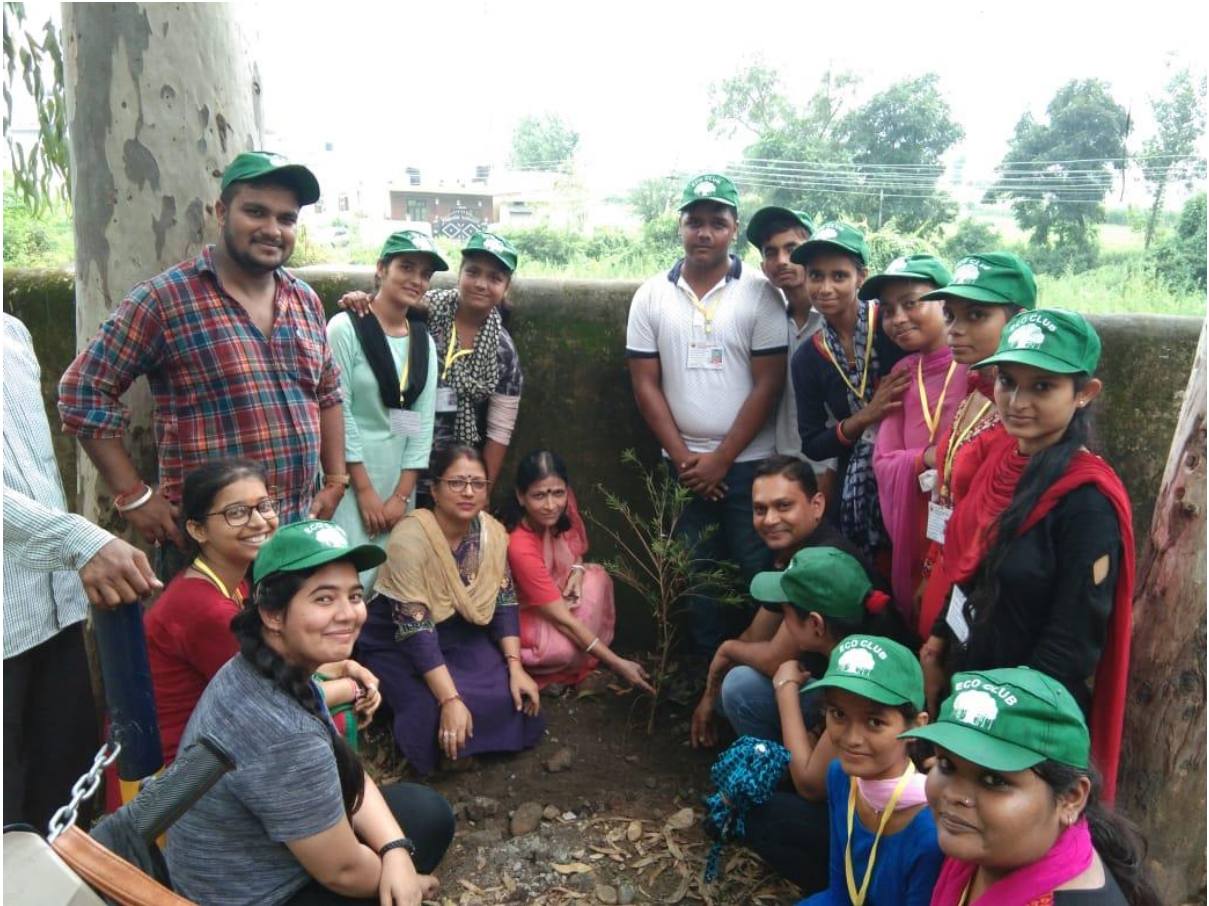
Photograph 46 Eco Club on mission to make Paonta, a Green City