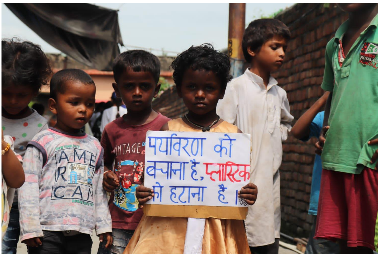
Photograph 1 Children in Slum Area promoting exclusion of plastic to save environment

The college adopts every year a slum area for community service. The college had adopted the Madras Basti, Slum area in Kripal Sheela Road and in Kunja Matralio during previous years. Awareness programmes like Swachch Bharat Abhiyan/ Cleanliness drives, Covid Vaccination, SOPs to combat Covid 19, menstrual hygiene, hand wash, drug abuse etc. are organized from time to time.