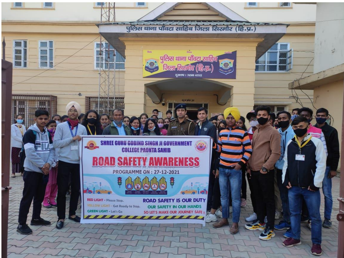
Photograph 26 Staff and students with Police officials during Road Safety Awareness programme

Road safety is increasingly becoming a major killer and a worldwide concern. Everyone needs to be well aware of the road traffic rules specially the young generation. The college takes the responsibility to get the youth realise his moral duty to follow traffic rules themselves, the drivers as well as by the people walking on road. Therefore, a Road Safety club is constituted to display traffic rules in the college and through various activities like slogan writing, poster making, rally and aiding in traffic duty with police. The students of the club followed the Gandhian philosophy by offering the rule breakers a rose stick and requesting them to observe traffic rules for his/her safety.