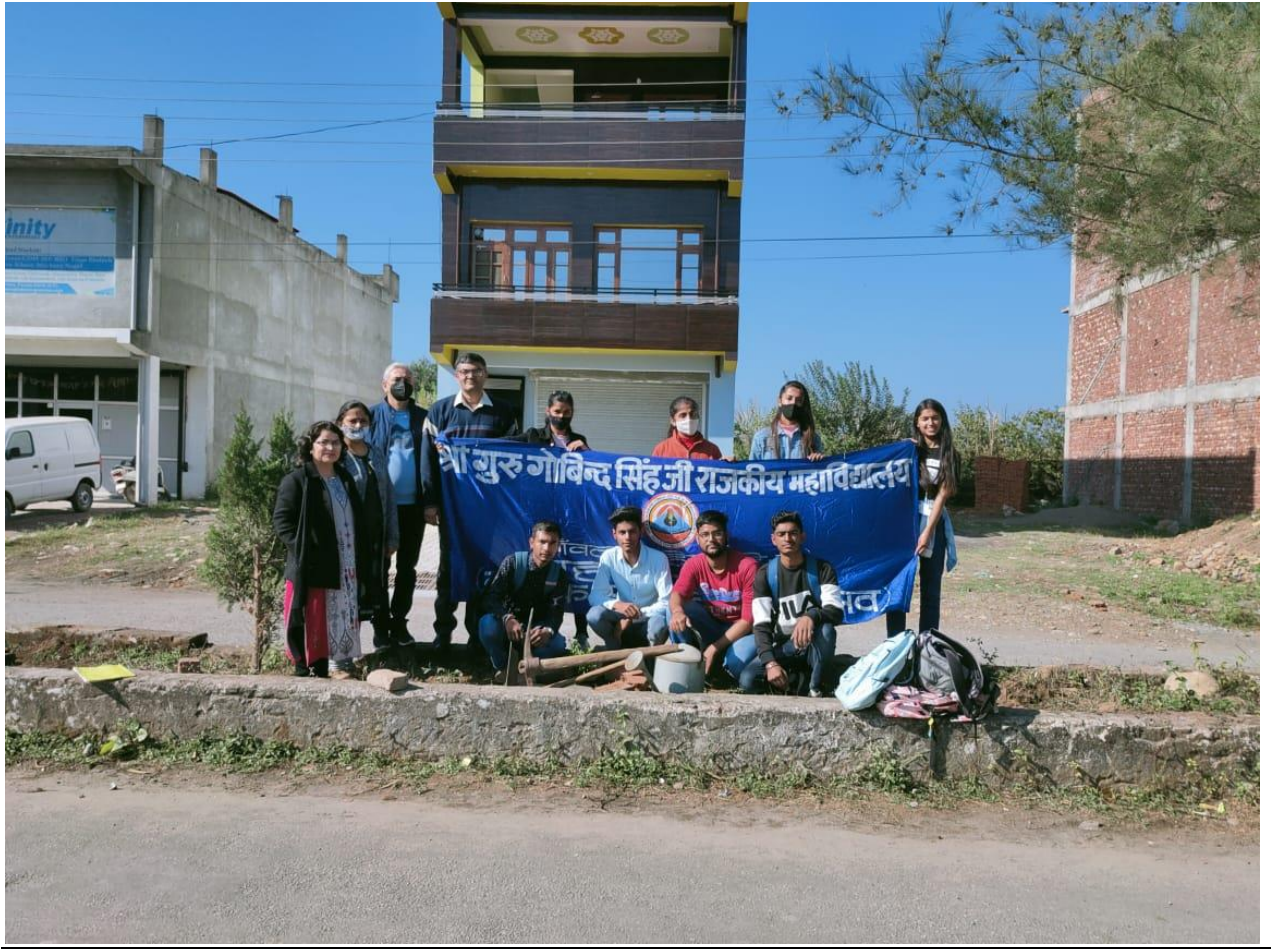
Photograph 55 Organising Committee with students after Plantation drive