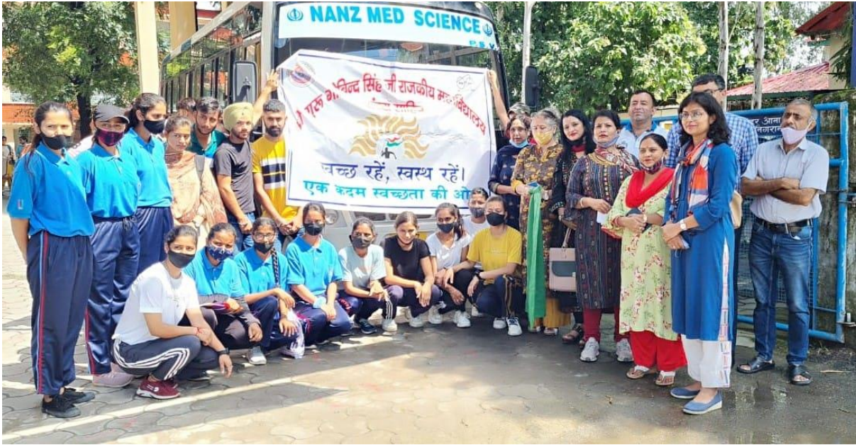
Photograph 49 staff with students gathered to move ahead for Swachhta program at Shivpur village