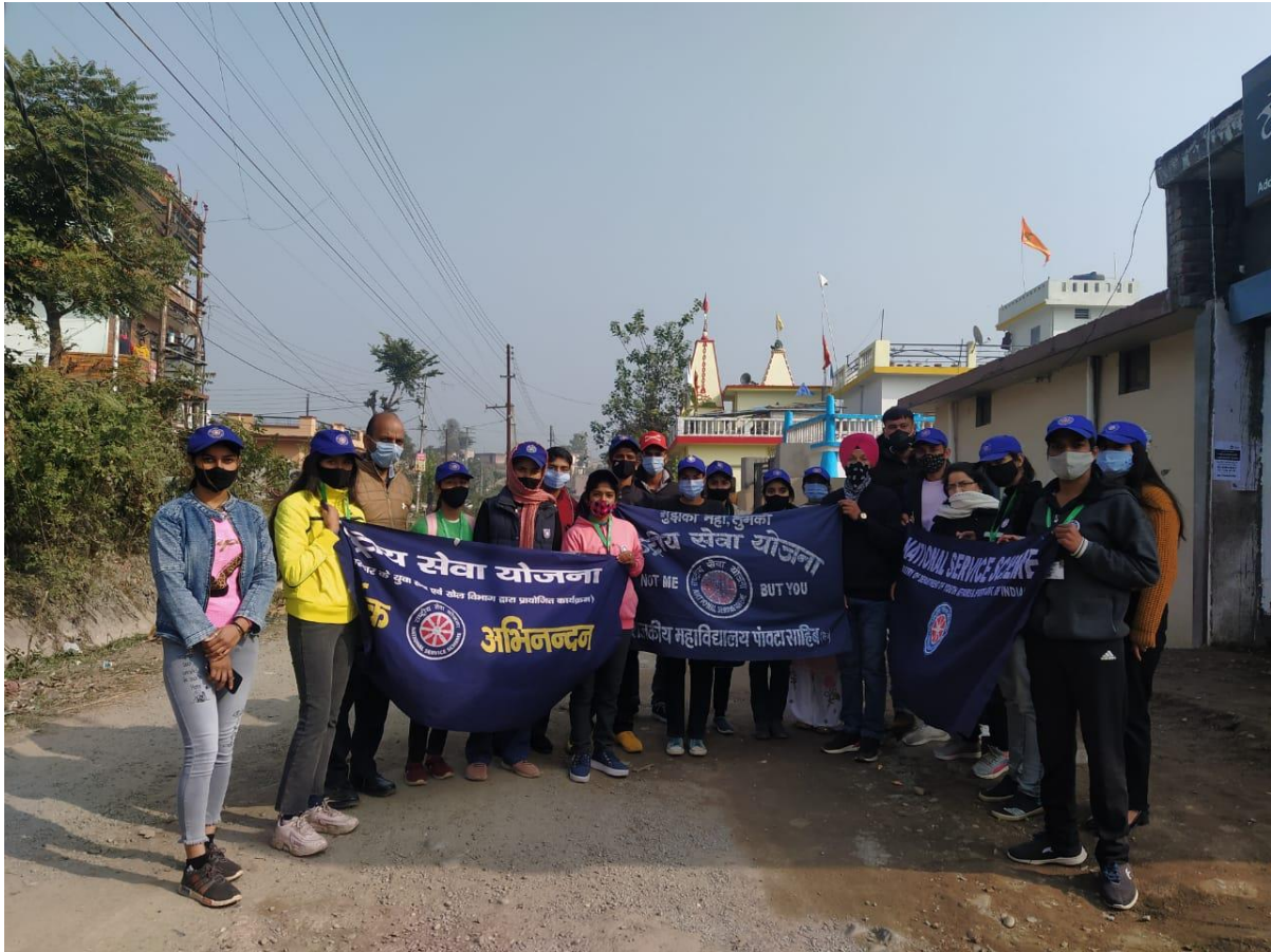
Photograph 29 NSS Unit at adopted village