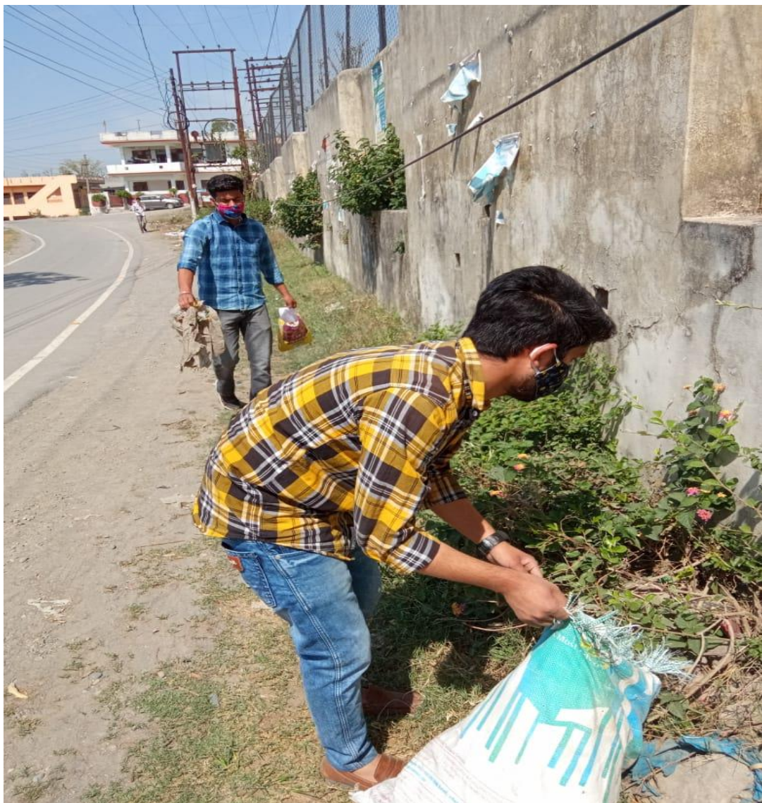
Photograph 11 Students removing waste from road to HIMUDA Colony