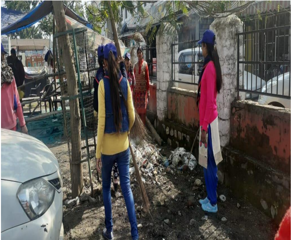
Photograph 15 students at Gurudwara Ground