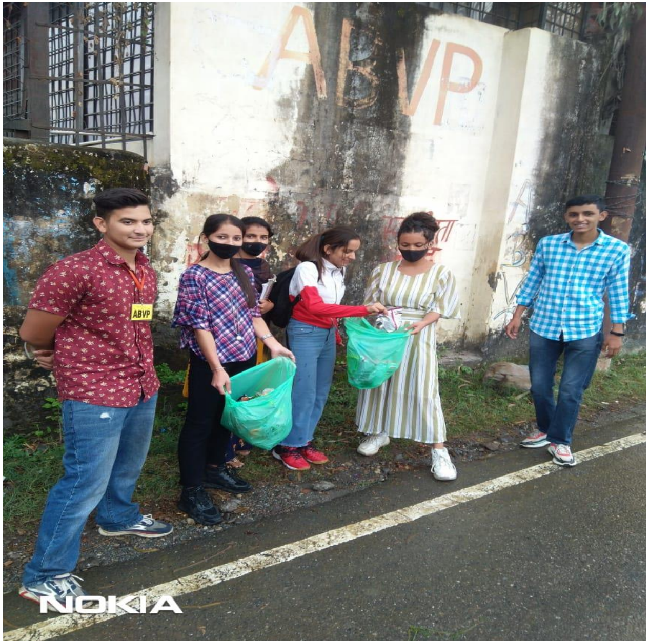
Photograph 63 Students outside the college campus