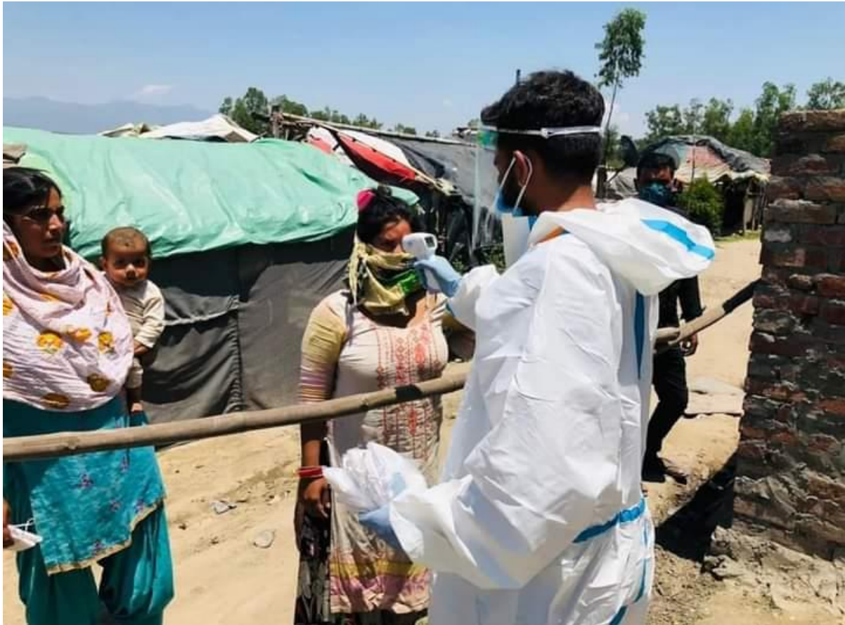
Photograph 3 Awareness regarding Vaccination and thermal screening by college student