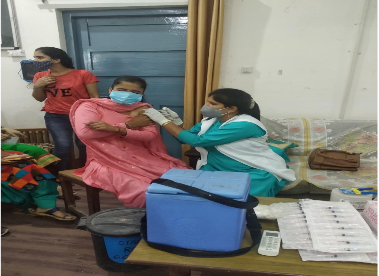
Photograph 18 Vaccination to combat against Covid 19

श्री गुरु गोबिंद सिंह जी राजकीय महाविद्यालय में दिनांक 28 जून 2021 को खंड स्वास्थ्य विभाग द्वारा कोरोना टीकाकरण अभियान चलाया गया जिसमें महाविद्यालय के स्टाफ, छात्रों एवं आस पास के लोगो द्वारा वेक्सिन लगवाई गयी. इस दौरान कुल 401 लोगो ने वेक्सिन लगवाई. स्वास्थ्य विभाग के साथ महाविद्यालय की राष्ट्रीय सेवा योजना इकाई के स्वयंसेवकों ने इस अभियान ने अपनी अहम भूमिका निभायी.