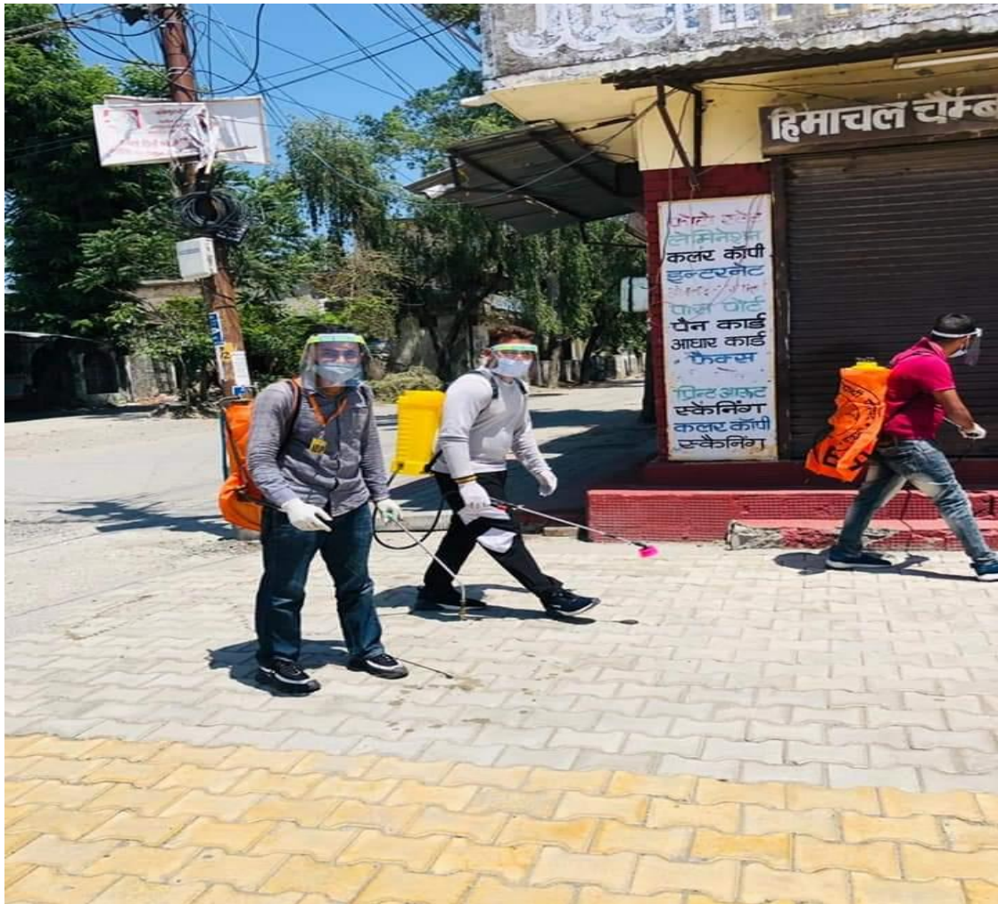
Photograph 35 Students in Market and SDM Court